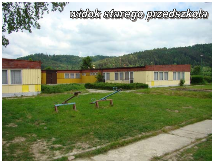
widok starego przedszkola