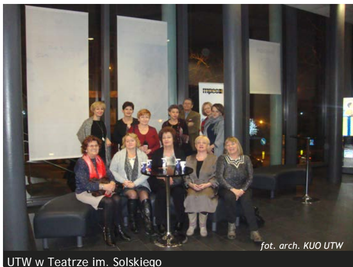
UTW w Teatrze im. Solkiego