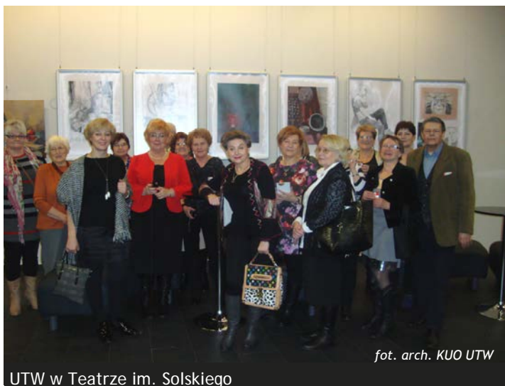
UTW w Teatrze im. Solkiego