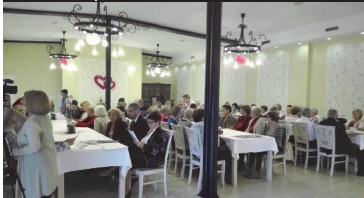
Sluchacze i Goście