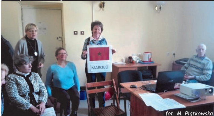
Na warsztatach podróżniczych