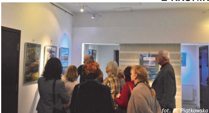
Na wystawie fotografii