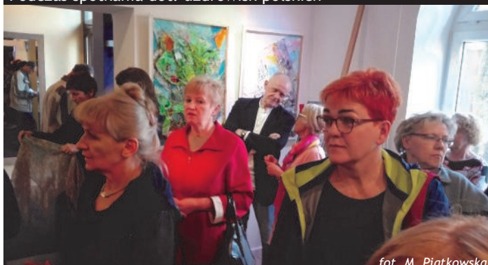
Na wystawie malarstwa