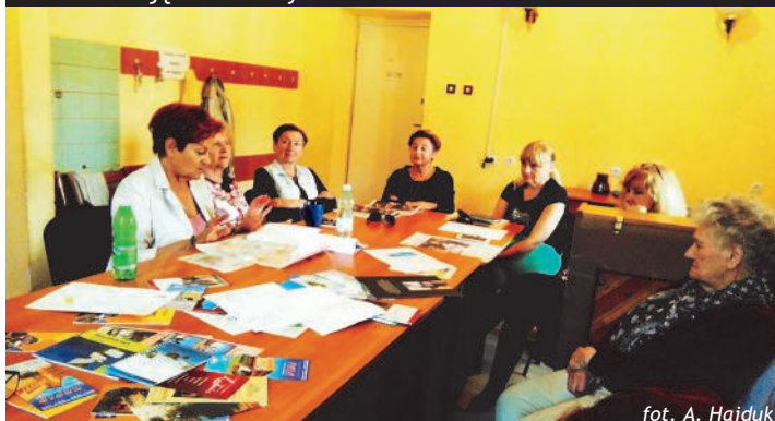
Podczas spotkania dot. uzdrowisk polskich