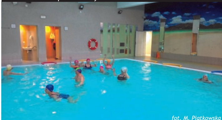
W trakcie gimnastyki w wodzie