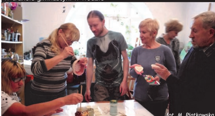
Na warsztatach ceramicznych.