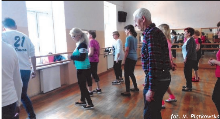
Podczas zajęć tanecznych